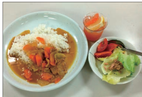
この日の「子ども食堂」の晩ご飯

川添2丁目「子ども食堂」を実施していると聞き、見学させていただきました。取り組んでおられる川添シヨツピングセンター1Fにある韓国風海苔巻き「のりまきのすけ」さんは「本当に救いたい子ほど食堂に来なくなる」ため、単に貧困対策とするのではなく、気軽に立ち寄れる「居場所」としての役割を重視されてきました。その中で少しでも助かる子どもがいるとお話されました。 月1回、定員20名、実施場所は川添夢ホール（川添2-3-19）で300円払えば晩ご飯が食べられます。チラシを地域にまいたり、市内の物産展で協力を求めるなど、今では地域の皆さんがボランティアに来てくれ、食材の援助などの輪がひろがっているのと。食事中、友達や地 域の人とみんなまで食べて楽しくおいしいアットホームな雰囲気を感じました。店主のお話では「今度いつ出るの？」と店に顔を出して楽しみにしている子もいて、「この子達を大事にしたい。もっと、地域で子ども食堂が広がって欲しい」と語っておられました。