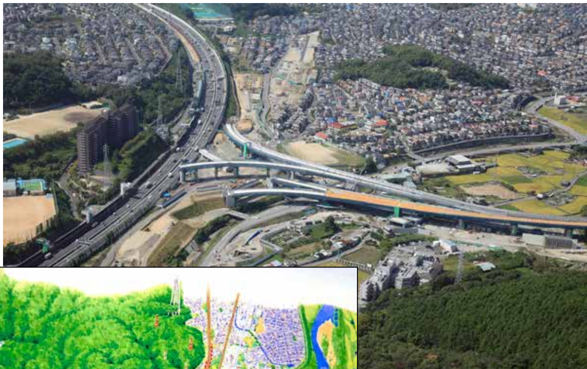
▶名神と新名神をつなぐ現在工事中のジャンクション

ため大変な状況です。今までも工事中の環境問題や、車両の出入りなど議会で質問してきましたが、日々変わる風景にびつくりしています。