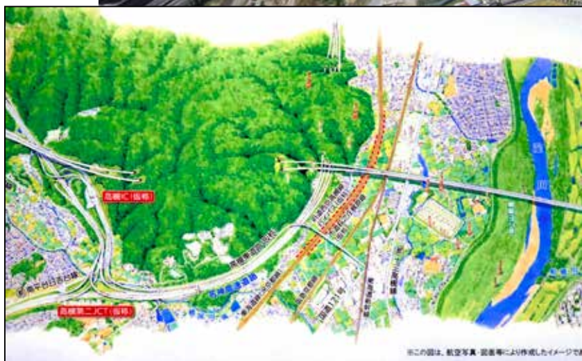
▲新名神の完成イメージ図

山が削られ、農地がなくなり、上を見れば高速度道路が何本もあり、工事中ですが、完成してから騒音や大気の測定をする必要があります。住環境を守るために議会でこれか