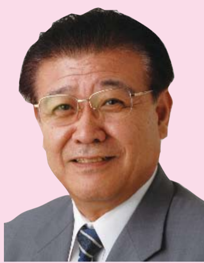
比比例代表 党書記長

しかし、日本政治にはあまりに異常な「アメリカ言いなり」と「大企業・財界の身勝手な横暴」から抜け出すまでには至っていません。日本共産党は、政治をさらに前にすすめる「建設的野党」としてがんばります。