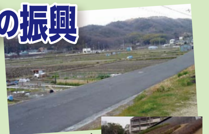
▲史跡新池ハニワ工場公園(上土室一丁目) ▲高槻に多く残る農地(塚脇・西之川原地域)

また、高槻には、弥生時代の安満遺跡、古墳時代の今城塚古墳、鬮鶏(つげ)山古墳などがあり、ボランティアの方も多く活躍されています。各施設を周遊するバスコースをつくるなど気軽に見学できる努力が求められます。