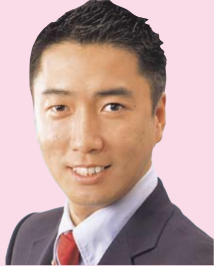
大阪選挙区 大阪市議員